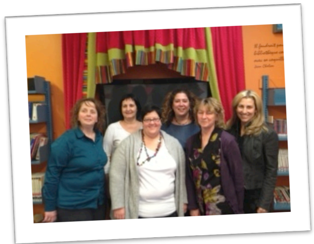
Les quatre enseignantes, la conseillère pédagogique et la chercheuse

Pour trouver réponses à ces questions et appuyer leurs actions sur des données issues de la recherche, les enseignantes et la conseillère pédagogique ont fait appel à une chercheuse spécialisée en didactique des premiers apprentissages au préscolaire et en émergence de l'écrit. De plus, une bibliothécaire scolaire et l'animatrice Passe-Partout de l'école ont été invitées à se joindre au projet. De pair avec leur direction d'établissement, toute cette équipe a décidé de développer un projet de recherche-action qui a permis de documenter l'expérimentation de la trousse dans les familles.