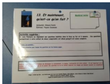
Une fiche d'activité