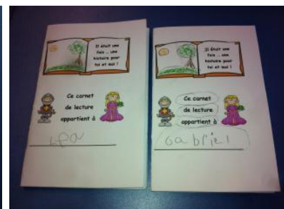
Un carnet d'appréciation de lecture

Au total, 25 pochettes ont été créées. Voici quelques exemples d'activités proposées aux élèves et à leurs parents.